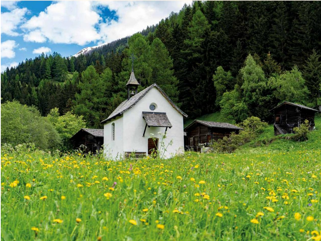
Nothelferkapelle St. Sebastian, Niederwald